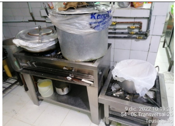
FOTOGRAFÍA No. 6. Estufa No. 3