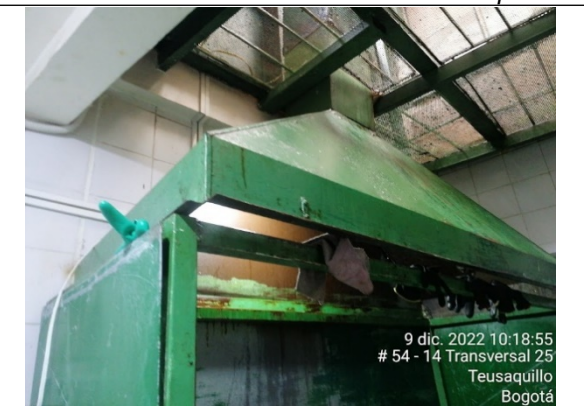
FOTOGRAFÍA No. 4. Campana de extracción y ducto de la Estufa No. 1