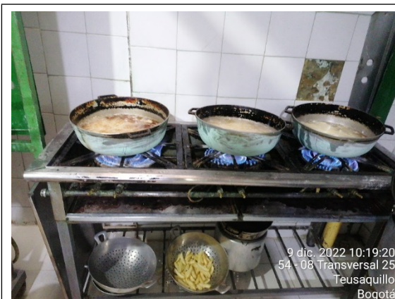
FOTOGRAFÍA No. 5. Horno No. 2