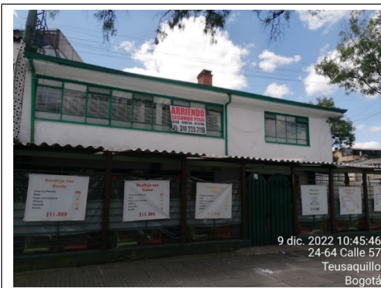
FOTOGRAFÍA No. 1. Fachada