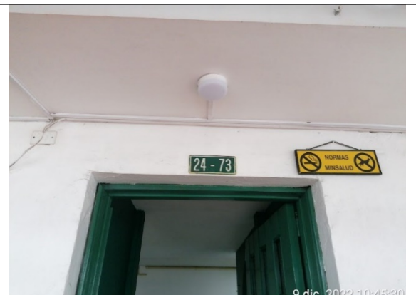
FOTOGRAFÍA No. 2. Nomenclatura del predio