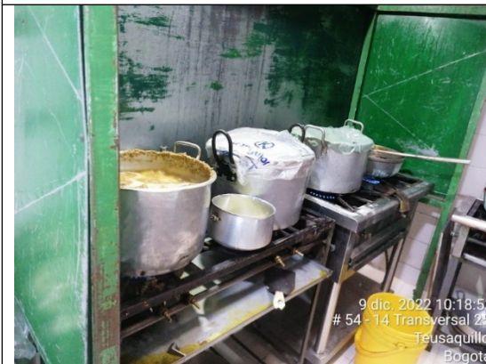
FOTOGRAFÍA No. 3. Estufas No. 1